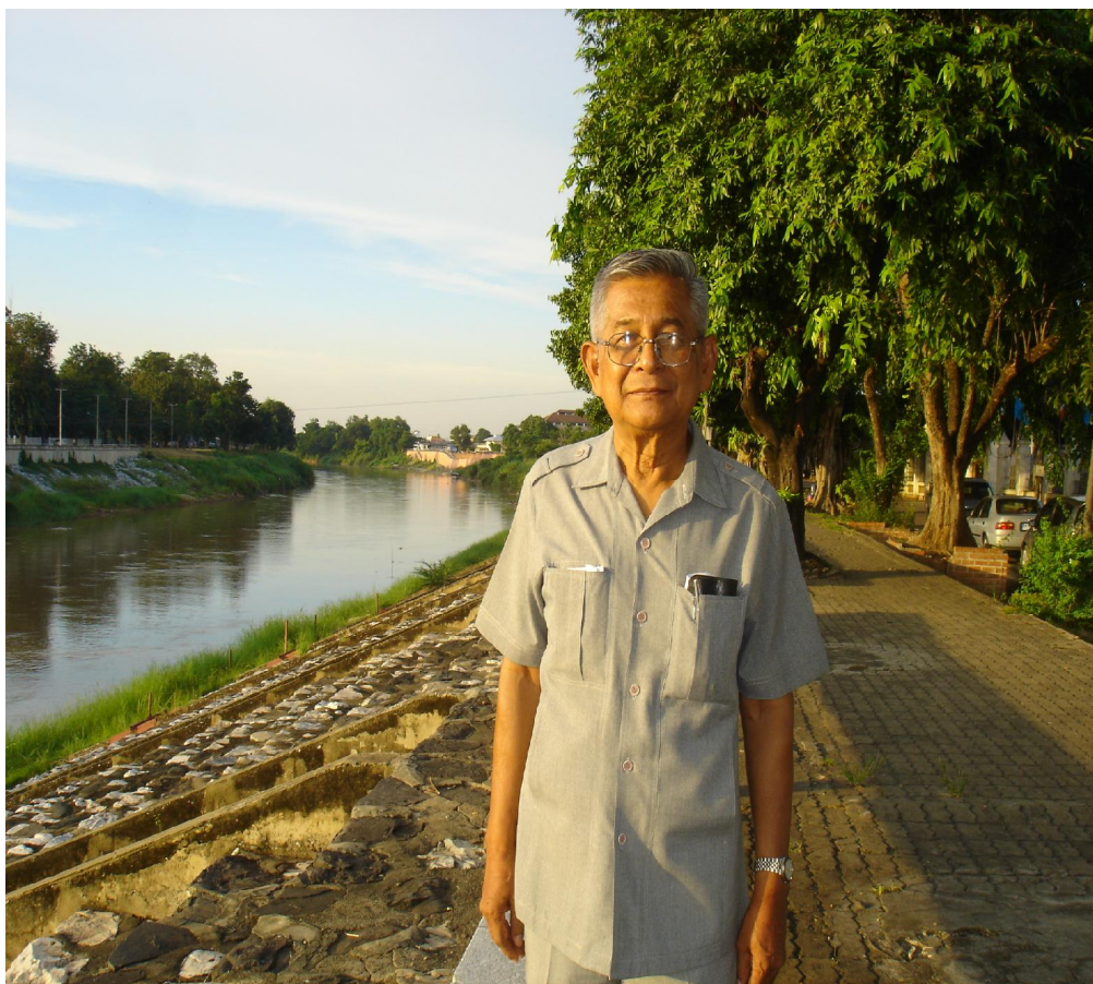
ศาสตราจารย์เกียรติคุณ ดร.ประเสริฐ วิทยารัฐ นายกสมาคมภูมิศาสตร์แห่งประเทศไทย คนที่ 2 พ.ศ. 2522–2524