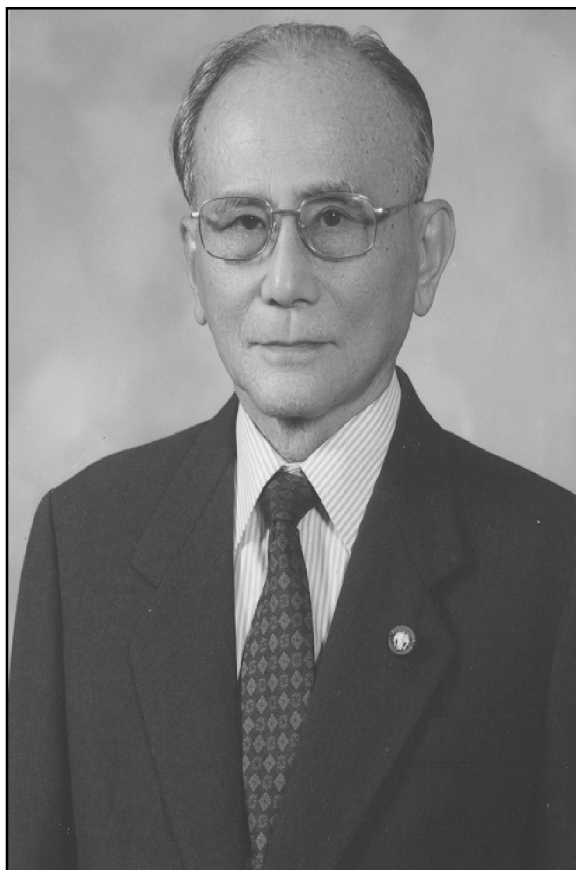
ศาสตราจารย์กิตติคุณไพฑูรย์ พงสะบุตร นายกสมาคมภูมิศาสตร์แห่งประเทศไทย คนที่ 3